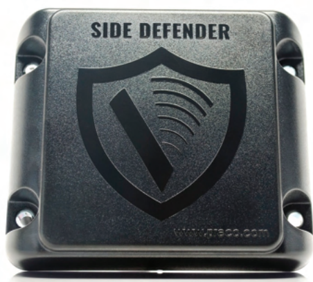
Senzor PRECO SIDE DEFENDER II

Produkt PRECO SIDE DEFENDER z našeho portfolia HEMAK SAFETY slouží k detekci objektů, včetně chodců a cyklistů, v bočních zónách vozidla. PRECO SIDE DEFENDER má široké zorné pole dopředu i dozadu. Odfiltruje nepohyblivé objekty, jako jsou například nárazové bariéry. Poskytuje řidiči zvukové a vizuální varování v kabině. Je určen pro nákladní vozidla, kolové nakladače, popelářské vozy, autobusy atd.