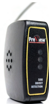
Vnitřní audiovizuální detekce

Technické provedení tohoto zařízení umožňuje plnou funkčnost v náročných podmínkách, mrazu a hrubém znečištění. PRECO SIDE DEFENDER je odolný vůči vysokotlakému čištění a poškození, odolává vysokým vibracím a nárazům a nevyžaduje údržbu. S rostoucími nároky na bezpečnost práce je PRECO SAFETY ideálním řešením, jak předcházet krizovým situacím a škodám na majetku.